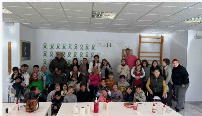
PROYECTO DE APRENDIZAJE EN COMUNIDAD