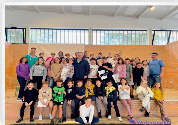
FOMENTAMOS EL PENSAMIENTO CRÍTICO