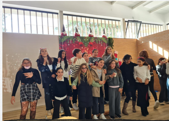
NOCHEVIEJA NEW YEAR'S EVE