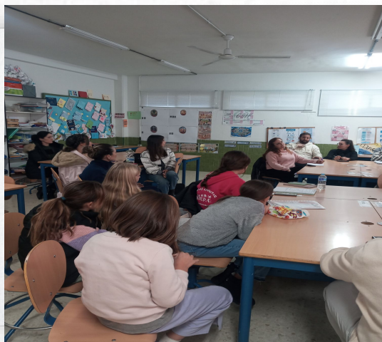
COMUNIDAD EDUCATIVA REPRESENTADA EN TODOS LOS ÁMBITOS