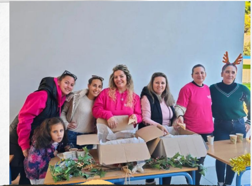
FIESTA DEL OTOÑO AUTUMN

En total sintonía con el Centro. Participa y ayuda en todas las actividades relacionadas con nuestras efemérides.