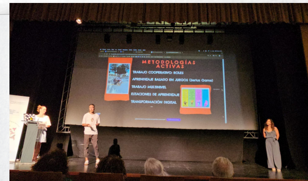
PONENTES DENTRO DE LAS PRÁCTICAS RELEVANTES DE ZONA

El acoso es problema de tod@s, se valiente y denúncialo, juntos somos más fuertes