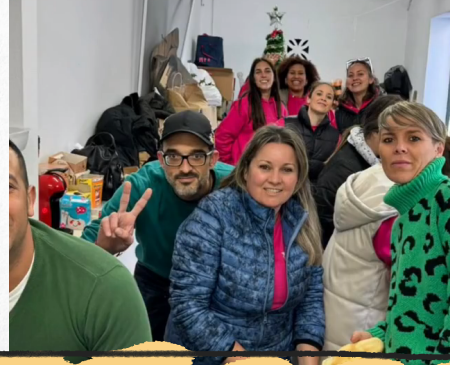
DÍA DE ANDALUCÍA ANDALUCIA'S DAY