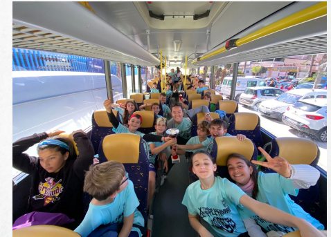
DEPORTE EN LA ESCUELA- SPORTS JORNADAS DE ATLETISMO