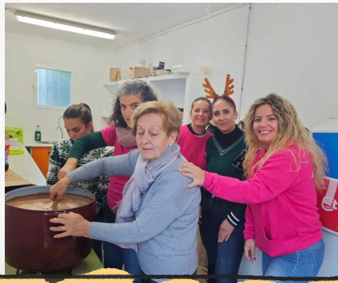
DÍA DE LA PAZ PEACE DAY

En total sintonía con el Centro. Participa y ayuda en todas las actividades relacionadas con nuestras efemérides.