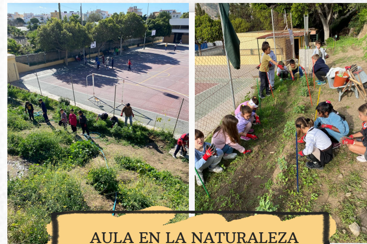
AULA EN LA NATURALEZA