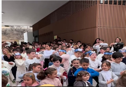
DÍA DE LA PAZ PEACE DAY